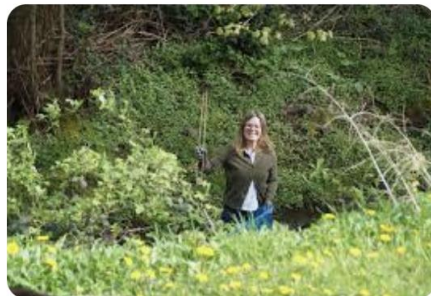
AusBadHonnef Honnefer Grüne sammeln erfolgreich b...