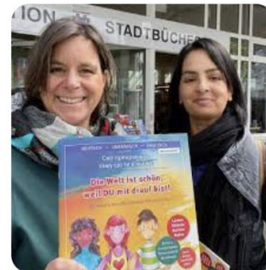
AusBadHonnef GRÜNE organisieren 3s...