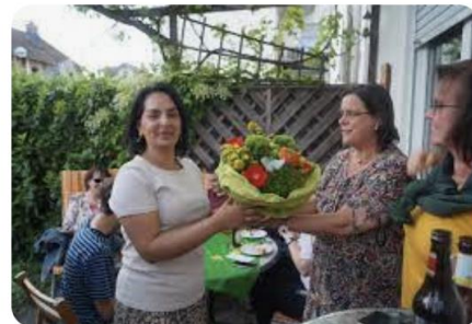
AusBadHonnef Grosse Freude nach der Landtagswah...